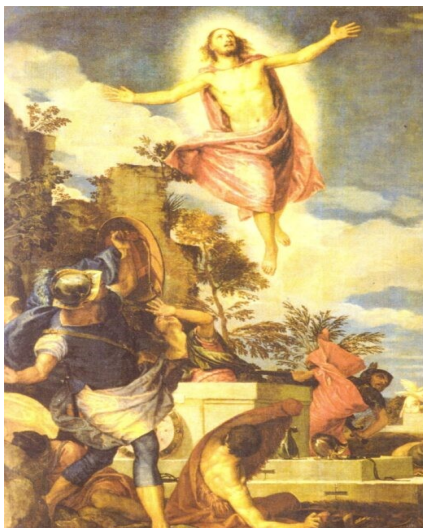
Paolo Veronese, La risurrezione di Cristo (1570)

ogni anno, nella liturgia del giorno di Pasqua, la Chiesa ci consegna parole antichissime e potenti: "Morte e vita si sono affrontate in un prodigioso duello: il Signore della vita era morto, ma ora vivo trionfa." Dentro questa frase c'è il cuore del Vangelo. La Pasqua nasce da uno scontro vero. Da una parte la morte con il suo carico di violenza, paura, ingiustizia e solitudine. Dall'altra la vita, fragile e apparentemente sconfitta sulla croce. Per tre giorni sembra che la morte abbia l'ultima parola. E guardando il mondo di oggi non è difficile riconoscere questo stesso dramma. Guerre che devastano popoli, tensioni tra le nazioni, una logica di potenza che spesso pensa di difendere la pace moltiplican-